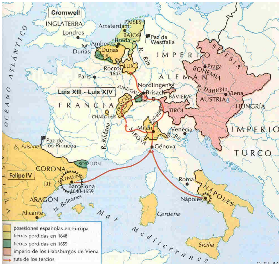
Mapa de la Paz de Westfallia

El siglo XVIII es un siglo en el que la influencia extranjera sobre todo en la dinastía francesa ahonda la decadencia de España, todas las ideas que vienen de fuera, atentan contra lo español: la ilustración, el anticlericalismo, la luz del progreso.