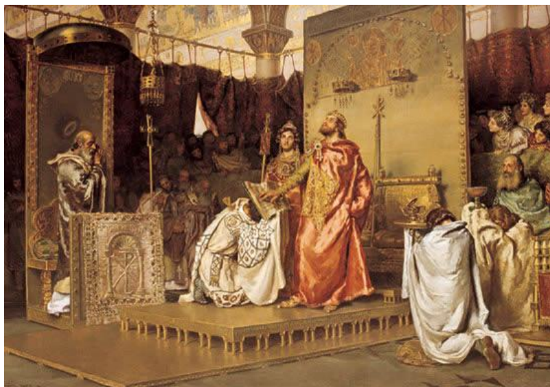
La conversión de Recaredo de Antonio Muñoz. Palacio del Senado. Madrid

Con la presencia visigoda se dan algunos de los hechos determinantes del ser español como la unidad territorial, la unidad política con la monarquía hereditaria, la unificación legislativa (Fuero Juzgo: que unía el derecho romano y el derecho visigodo) y la unidad religiosa: la conversión al catolicismo de Recaredo en el III Concilio de Toledo (589)