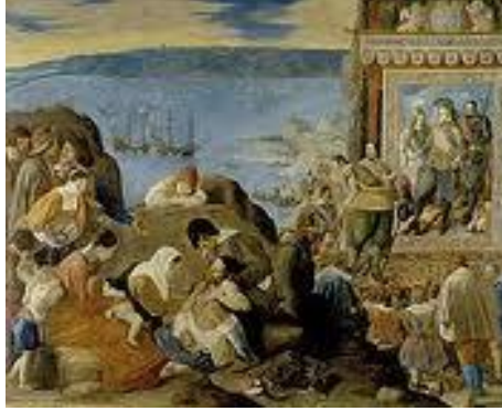
La recuperación de Bahía. Juan Sebastián Maino (Museo del Prado)

El periodo de los “Austrias” queda planteado desde la perspectiva de la defensa del imperio y de la fe con Carlos V y Felipe II a lo largo del siglo XVI. España será “luz de Trento, martillo de herejes, cuna de San Ignacio”, que además genera desde el punto de vista artístico el siglo de Oro.