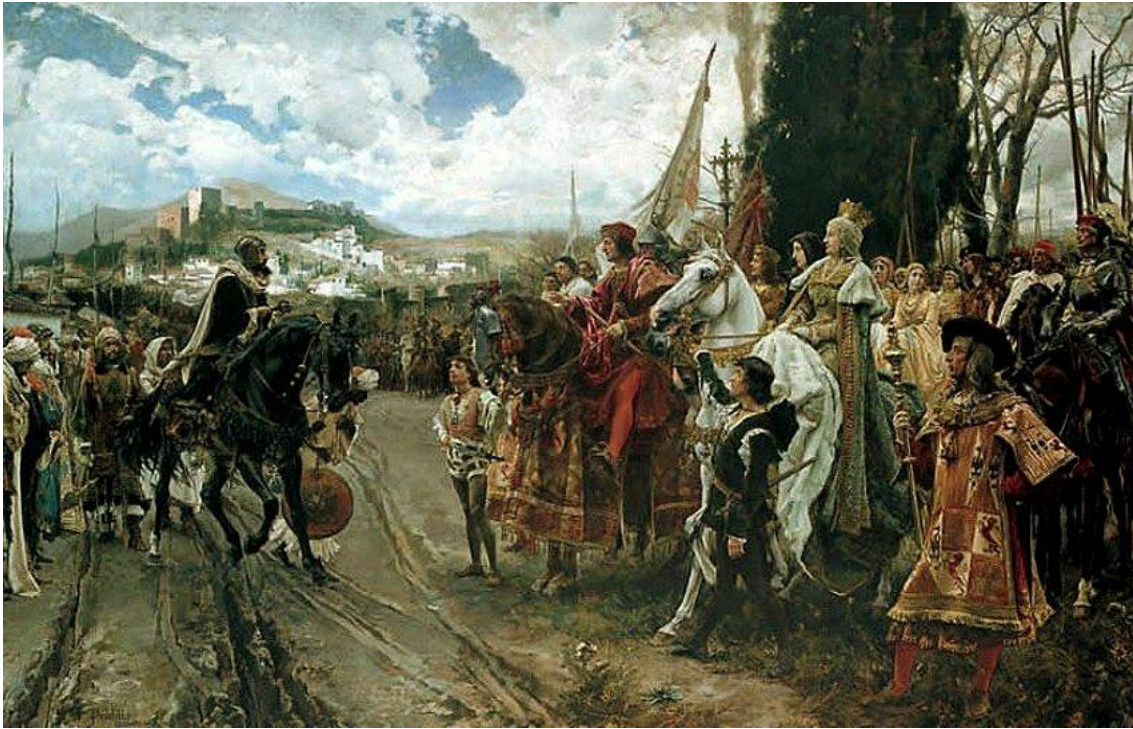
La rendición de Granada de Francisco Pradilla. Palacio del Senado. Madrid.

Con los Reyes Católicos se alcanza la unidad nacional definitiva y se lleva a efecto la gran aportación española a la humanidad: el Descubrimiento de América y la expansión del cristianismo. 1492 tiene muchos significados porque además de sentar las bases para la forja del imperio, supone la fecha de la definitiva unidad religiosa de España: toma de Granada (último reino musulmán en la península) y expulsión de los judíos.