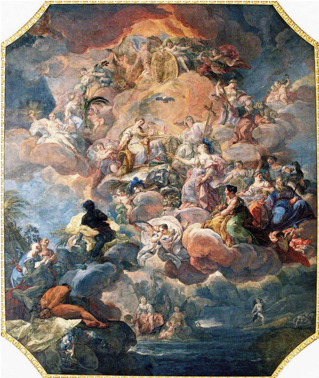
España ante la religión y la Iglesia por Conrado Guiso 1759 Bóveda del Palacio Real

La idea de España se configura a través de un triple sostén: Monarquía, catolicismo y soberanía territorial