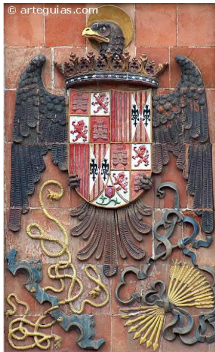
Escudo de los Reyes Católicos